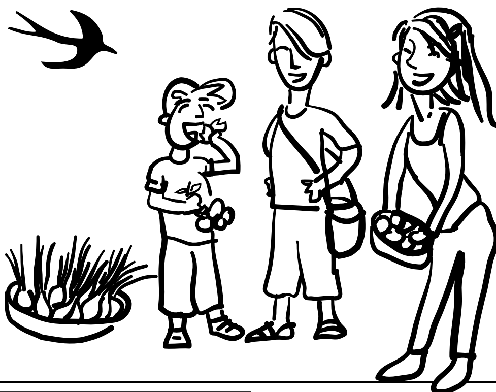
Ilustración: ANNA ROIG

CARTA DE AGRADECIMIENTO por apoyar nuestro proyecto